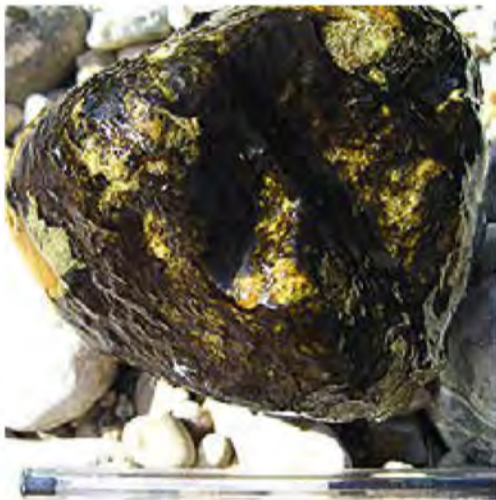
Biofilm à cyanobactéries Le biofilm est la pellicule glissante qui se développe au fond des rivières.

Les cyanobactéries sont des bactéries ressemblant à des algues microscopiques.