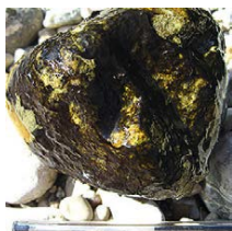
Biofilm à cyanobactéries

Les cyanobactéries sont des bactéries ressemblant à des algues microscopiques.