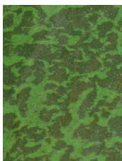
Aspect possible d'une efflorescence de cyanobactéries

Elles peuvent parfois se développer dans les rivières et les plans d'eau. Ce phénomène n'est pas alarmant mais il peut présenter un risque sanitaire pour la santé humaine et animale. Dans certains cas elles peuvent former une efflorescence verte à la surface de l'eau, ou bien se fixer sur les cailloux et en formant des biofilms* verts / bruns, qui peuvent se détacher (flocs*), flotter et s'accumuler sur les bords de berges.