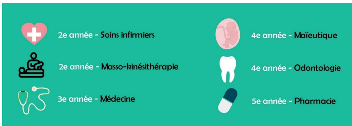
Figure 1 : Années de formation concernées par le service sanitaire en fonction des filières

Les années de formations concernées par le service sanitaire varient selon les filières (cf. figure 1).