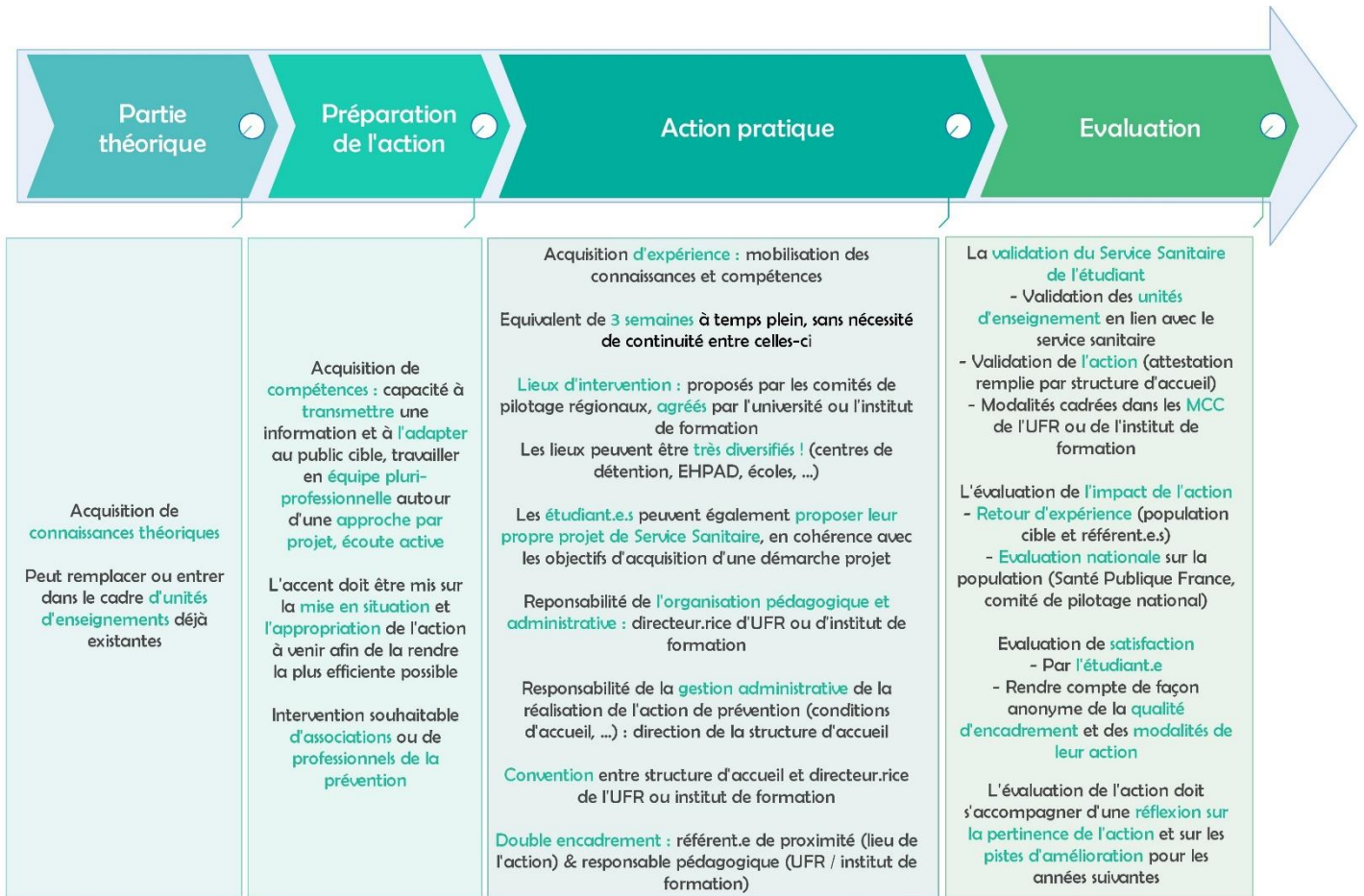
Figure 2 : Le service sanitaire : un déroulement en 4 temps

Remarques relatives au déroulement de l'action du service sanitaire vis-à-vis du déroulement des stages et enseignements cliniques :